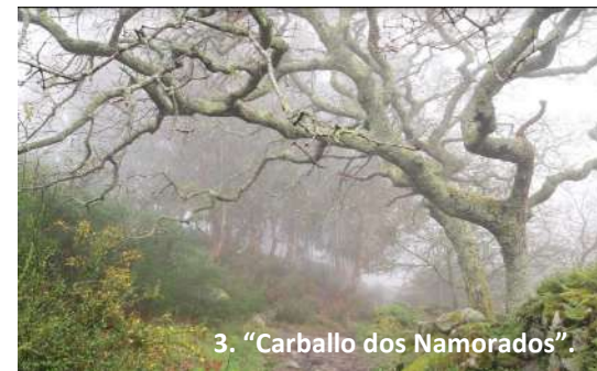
3. “Carballo dos Namorados”.

A costa da Vela forma parte da Rede Natura 2000 do LIC e do ZEC. Nesta contorna natural privilexiada, destaca polo seu valor natural o Cabo Home . Ao longo do roteiro distínguense a Estrela-cornacervo , o Toxo , a Ruda , o Trobisco , a Herba de namorar e a Camaria . Interesantes polo seu valor natural e tradicional. A Estrela-Cornacervo era empregada en infusións para calmar os nervios e como amuleto da sorte; A Ruda empregábase como herba abortiva e nos saquiños da envexa; O Trobisco empregábase para pescar (hoxe prohibido) e para facer cordas; A Herba de namorar como remedio para o desamor; A Camariña planta endémica da costa atlántica ibérica, e da cal hoxe en día só contamos cun exemplar de femia adulta en todo o Morrazo, era coñecida como herba da fame pola importancia dos seus froitos para calmar o estómago. O Toxo unha planta moi asociada a costa atlántica galega usábase nas cortes, e para tinguir a roupa. A sensación de floración eterna do toxo en Galicia ven provocada por ser tres especies con distinto periodo de floración que adoitan existir sempre na mesma zona.