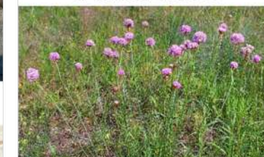
10. Clavelina de mar/Herba