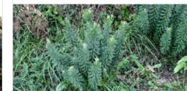
9. Torvisco/ Trobisco