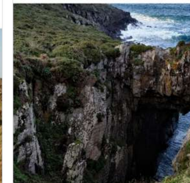
10. Cueva Marina/Furna