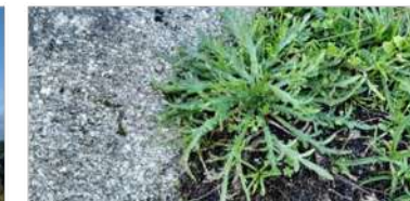
2. Hierba Estrella/Estrela-Cornacervo