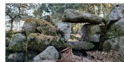
4. Aldea medieval Punxeiro