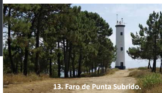
13. Faro de Punta Subrido.

Por outra banda, os faros de Cabo Home, Robaleira e de Punta Subrido construídos durante o século XIX son testemuñas dos perigos que entrañaba navegar por este lugar. Completa este patrimonio a escultura da Buguina realizada por Lito Portela en 2005.