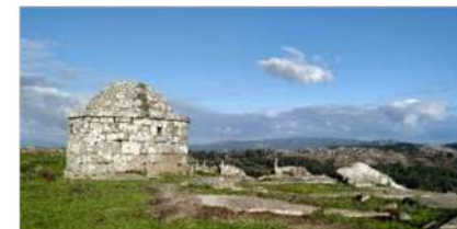
5. Garita Facho