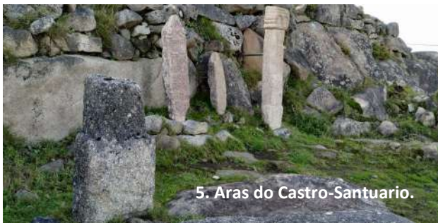
5. Aras do Castro-Santuario.

Cunha dilatada ocupación ao longo do tempo, no “Monte do Facho” atopamos evidencias da presenza humana de diversas épocas. Con estacións de arte rupestre, restos da idade do bronce (2500 - 700 a. C.), e do ferro (VI a. C. - I d. C.), de época romana e época medieval, destacando pola súa singularidade os restos do Santuario Galaico-Romano (III-IV d. C.) de Berobreo , localizado no alto do monte e onde se descubriron 174 aras votivas. O roteiro remata na última construción realizada no Monte do Facho, a Garita, un posto de vixilancia costeira con fins militares do século XVIII. e permite gozar das impresionantes vistas da Costa da Vela.