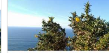
7. Tojo Marino/Toxo mariño