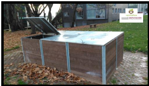
Foto: Centro de Compostaxe Comunitario en Xardíns dos Xulgados

Hai tres centros de compostaxe comunitaria na Vila de Cangas. Todas as familias que queiran participar no plan terán que recibir un pequeno asesoramento do noso Mestre Composteiro para que entre todos e todas fagamos unha correcta xestión. Elixo a zona que che quede máis preto!